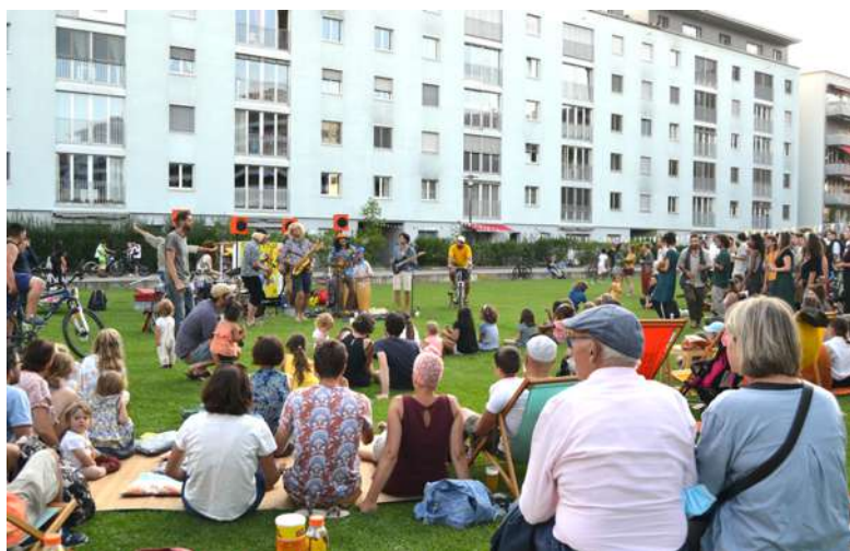
Cyclo-concert de Saraka, Péroilles 20 juillet 2021.

Pour donner une dimension festive à la tournée, au moins trois événements culturels professionnels étaient programmés par étape : 1 atelier de création artistique, 1 show de rue et 1 concert prévu en acoustique ou sur le Cyclotone – ce système où des cyclistes produisent l'électricité nécessaire à la sonorisation des musicien-ne-s.