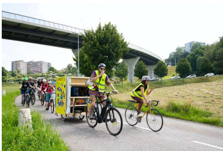
La parade à vélo du 18 juillet 2021, pour relier Schönberg et Basse-Ville.

Étape 4 | 18 au 21 août | Péroilles – Domino