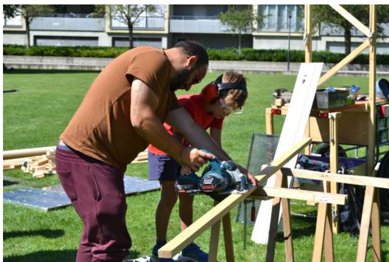
Chantier à Pérolles.

Notre équipe a également travaillé avec des adolescent-e-s, sur la fabrication préalable des charrettes, en juin. Une dizaine de jeunes en lien avec 2 institutions fribourgeoises se sont engagés pour leur construction à la Ressourcerie .