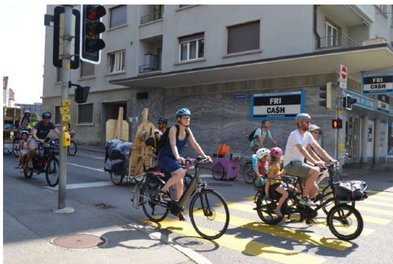
La parade du 15 août 2021, pour relier Jura et Péroilles.

Tout en sensibilisant à la mobilité douce, ces cortèges ont été tracés, puis autorisés par la Police locale, encadrés par une team « Titane » en fluo, afin que les participant·e·s circulent en toute sécurité. Ils se sont révélés être un incroyable moyen de promotion en ville de Fribourg, une fantastique aventure pour les cyclistes. Les CHARRETTES! ont pu compter sur le savoir-faire du collectif Faites du vélo pour mener à bien cette entreprise.