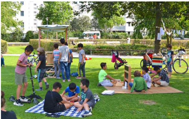
Accueil libre à Péroilles.