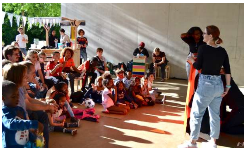
Théâtre d'impro par le Collectif d'abord, Schönberg 13 juillet 2021.

Les événements programmés par Espace-Temps étaient l'invitation à se déplacer entre quartiers et aller à la rencontre de leur population. Une buvette d'appoint, accessible les vendredis et samedis soirs, a permis d'accueillir le public en convivialité.